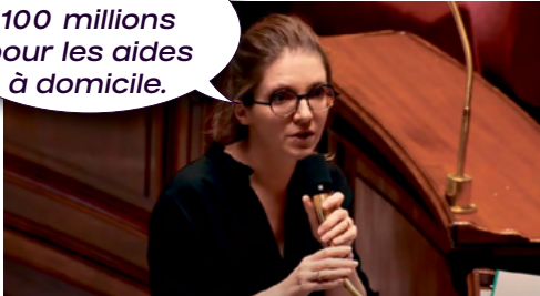
Aurore Bergé, ministre des Solidarités, spécialiste des annonces bidons.

Nous mettons 100 millions pour les aides à domicile.