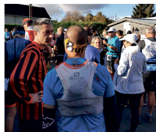
Au départ des 20 km de Picquigny .