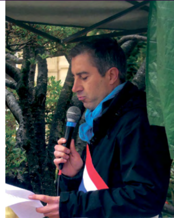
Rassemblement à Amiens pour la paix au Proche-Orient.

Voilà le principe, moral, mais aussi géopolitique, qui nous guide : pas de deux poids, deux mesures. Pas de cécité dans l'humanité. »