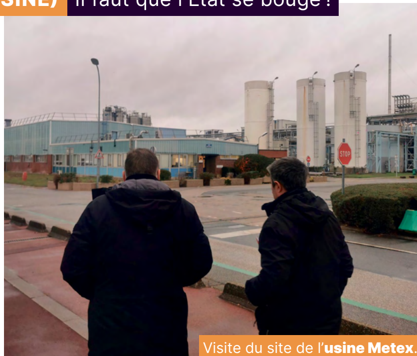
Visite du site de l'usine Metex.

On a mis tout le monde autour de la table et rencontré Bruno Bonnell , Secrétaire général pour l'investissement, chargé de flécher les milliards d'euros du plan France 2030. Pour lui, « Metex est le modèle de l'entreprise que France 2030 doit soutenir. » Après les paroles, on attend les actes.